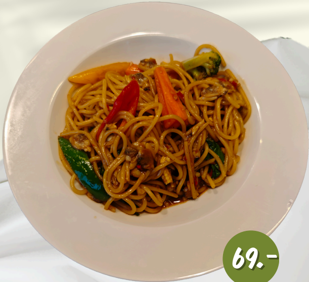
P7 สปาเก็ตตี้ หอยลาย ผักพริกเผา