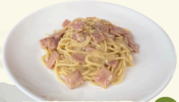
P11 สปาเก็ตตี้ ครีมซอสแฮม