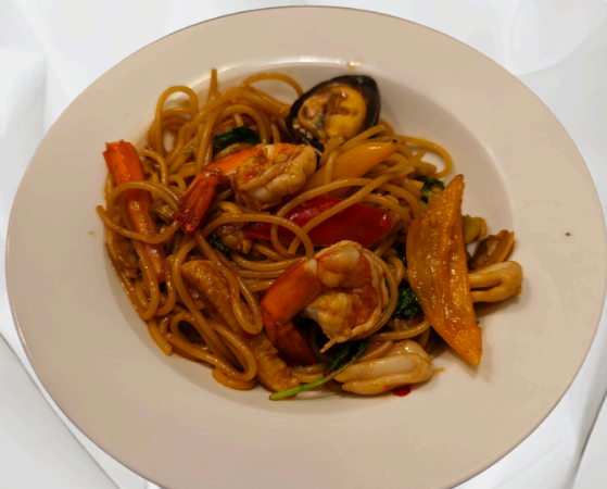
P9 สปาเก็ตตี้ บิ๊มาทะเล