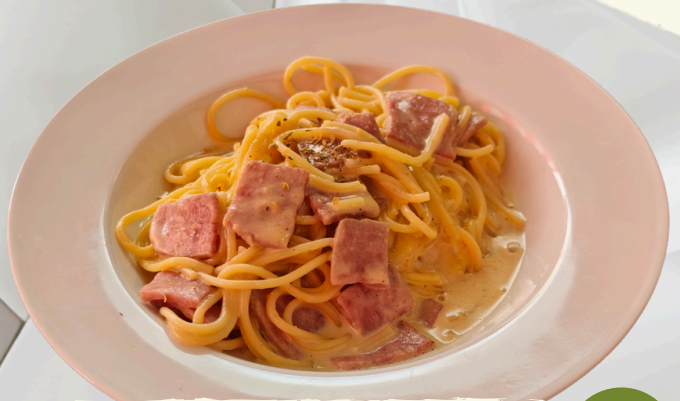
P14 สปาเก็ตตี้ คาโบนาร่า เบคอน