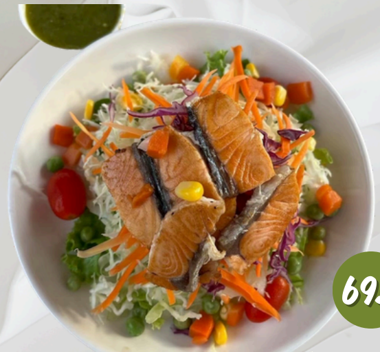
L3 สลัด แซลมอนยำแซ่บ