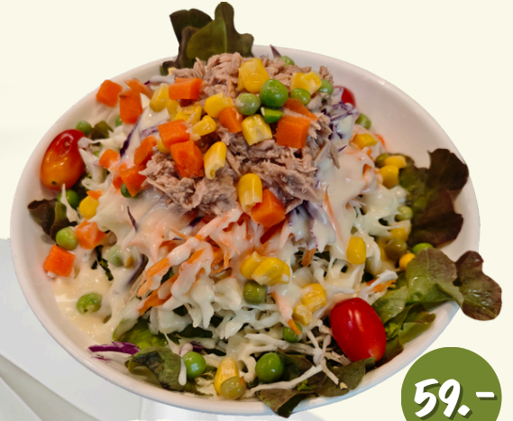
L2 สลัด ทูน่ามายองเนส