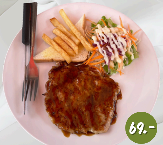
S4 หมู เทอริยากิ