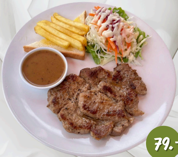
S3 หมู นุ่มพริกไทยดำ