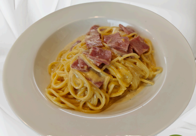
P13 สปาเก็ตตี้ คาโบนาร่า แฮม