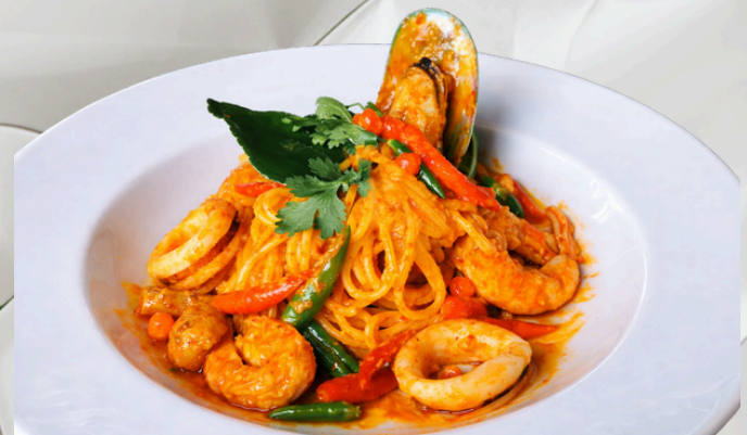
P17 สปาเก็ตตี้ ต้มยำทะเล