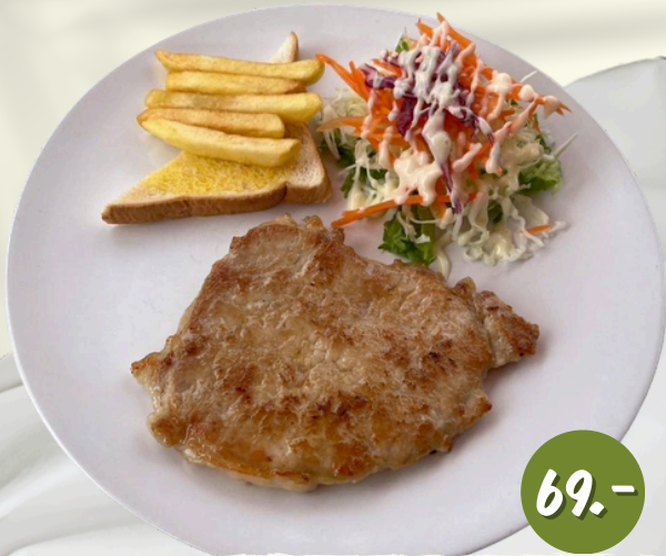
S1 หมู (ดี๊ก)