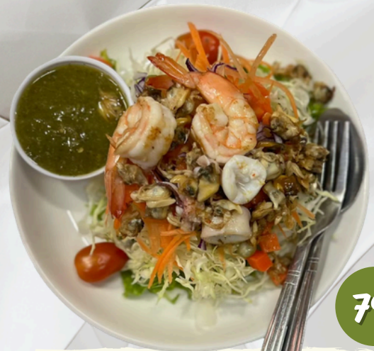
L4 สลัด ซีฟู้ดยำแซ่บ