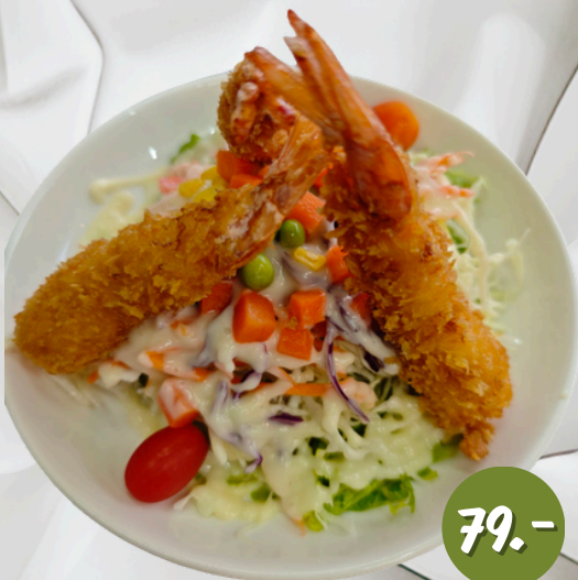
L5 สลัด กุ้งทอด