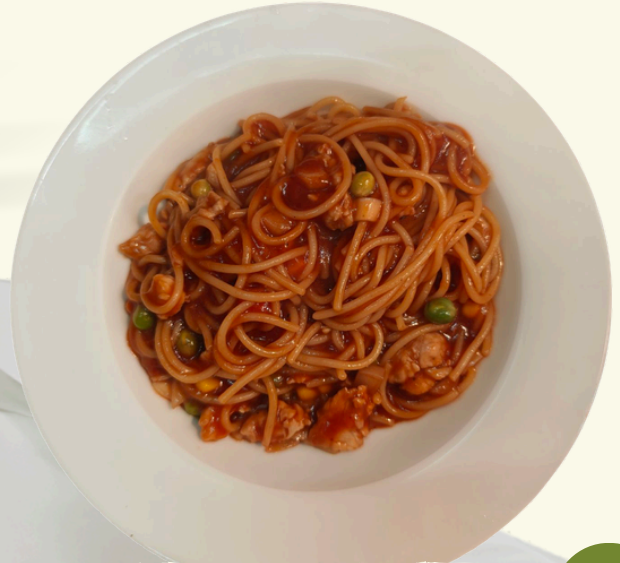
P1 สปาเก็ตตี้ หมูย่าง พริกไทยดำ