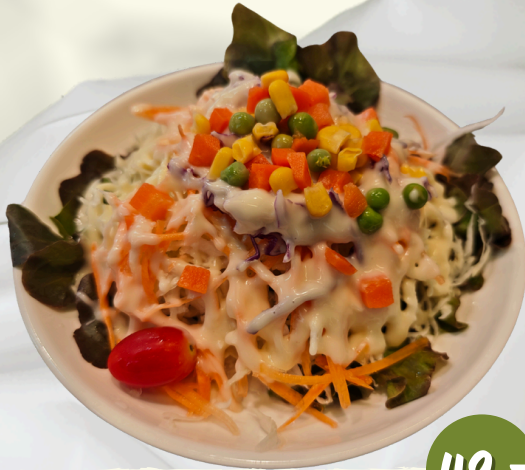
L1 สลัด ผัก