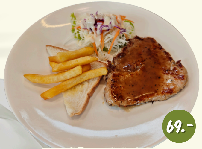
S2 หมู พริกไทยดำ