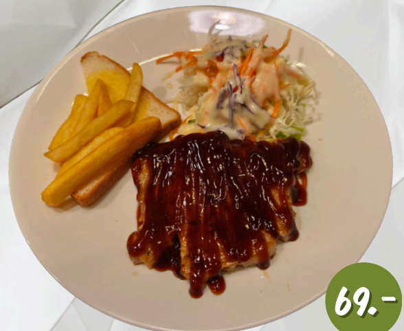
S6 หมู บาบีคิว